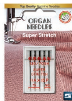
Super Stretch (HAx13P)

Superstretch-nålen (medium ball point) er tilpasset overlockens høye syhastighet og har en kuleformet spiss som tillater griperen å komme nær nålen for å lage perfekte sting.