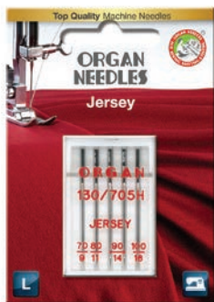
Jersey (SUK Ball Point)

Til vevde og elastiske stoffer som single jersey, fleece, bade- og treningsstoff brukes jersey nålen som har en kuleformet spiss. Den kuleformede spissen går lett igjennom stoffets tråder som forhindrer rakning av maskene. Sy med sytråd av god kvalitet.